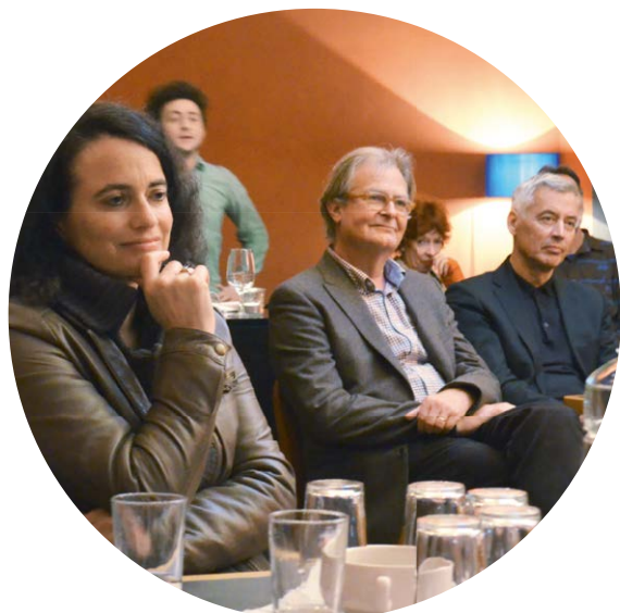
Soirée à Bâle avec l'association GjakoBasel.