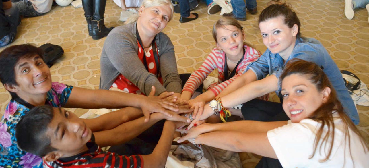
Participants à la rencontre CATS