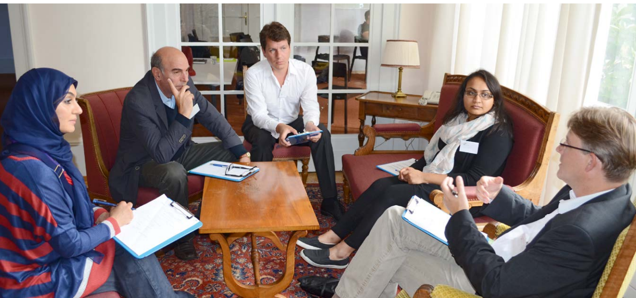
Un groupe de discussion pendant la formation « Au cœur d'un leadership efficace » à la Villa Maria.