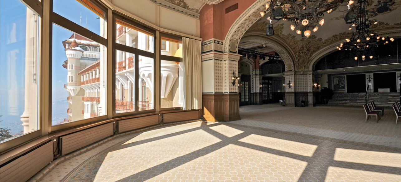
La salle plénière du Centre de Rencontres de Caux avec vue sur le Lac Léman