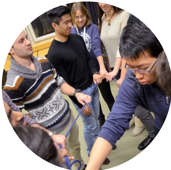
Atelier I&C pour les étudiants:

Du 19 au 21 septembre, vingt participants issus d'une douzaine de pays ont participé à la première version européenne du programme « Au cœur d'un leadership efficace » à Caux, en Suisse. Ce programme qui a fait ses preuves a été développé par I&C Inde et vise à provoquer une prise de conscience chez les participants de leurs valeurs et objectifs et à développer leur capacité à être leur propre leader, afin qu'ils puissent faire des choix plus éclairés. Le programme a été mené par une équipe composée d'Indiens et d'Européens expérimentés qui ont partagé leurs histoires personnelles sur la gestion éthique d'entreprises. En plus de ces témoignages qui n'ont laissé personne indifférent, les participants ont pu réveiller le leader qui dormait en eux grâce, notamment, à des chants ou à des promenades en silence.